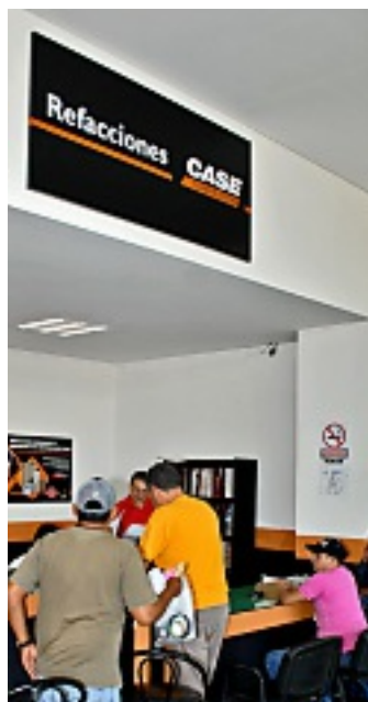
Área de atención a clientes.

Para AMECO Services el servicio de postventa es fundamental para lograr la satisfacción total de sus clientes, por lo que el departamento de refacciones juega un papel muy importante en la operación.