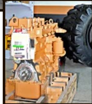
Productos y refacciones.