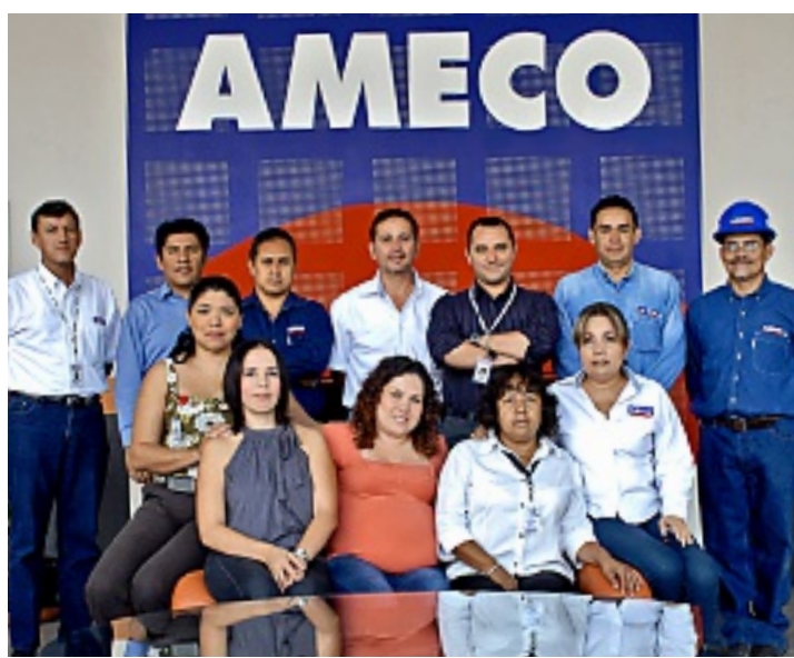
Equipo de trabajo de AMECO.

AMECO representa más de 25 marcas de refacciones, siendo las principales: Case, Ingersollrand, Volvo, JLG, Pallfinger, Terex, Clark, Grove JCB, con partes para motor, transmisión, diferenciales, herramienta de corte, aceites y filtros, etc.